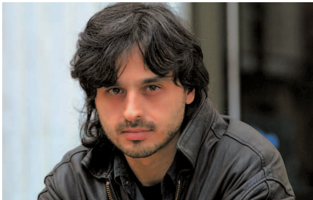
DIRECTOR DE CINE

Tengo 34 años. Nací en Calabria y vivo en Roma. Estoy soltero y vivo solo. Me licencié en Derecho. Mi ideología política es defender a los débiles a toda costa. En Italia ya no se distingue quién es de derechas y quién de izquierdas, son todos iguales. Soy ateo. He estrenado “Veneno” en el Festival de Cine de Derechos Humanos de Barcelona